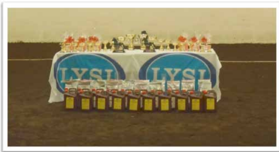
Mynd: verðlaunagripir á Þrígangsmótinu.