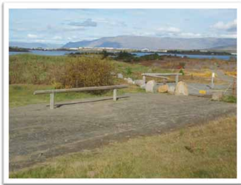
Mynd: Áningar við Þingnes.