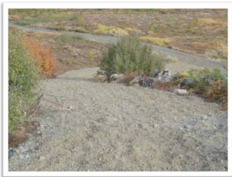
Mynd: Reiðvegatenging af Gunnarsbraut á Tungustíg.

Verulegar endurbætur voru gerðar á Tungustíg, reiðvegi niður með Hjöllum þ.e. frá Gunnarsbraut (vatnslögnin) á um 1. km. kafla þaðan og niður með Hjöllum. Skipt var um jarðveg þar sem stóra forarvilpan myndaðist í leysingum sl. vor og yfirborðsefni sett á þennan kafla.