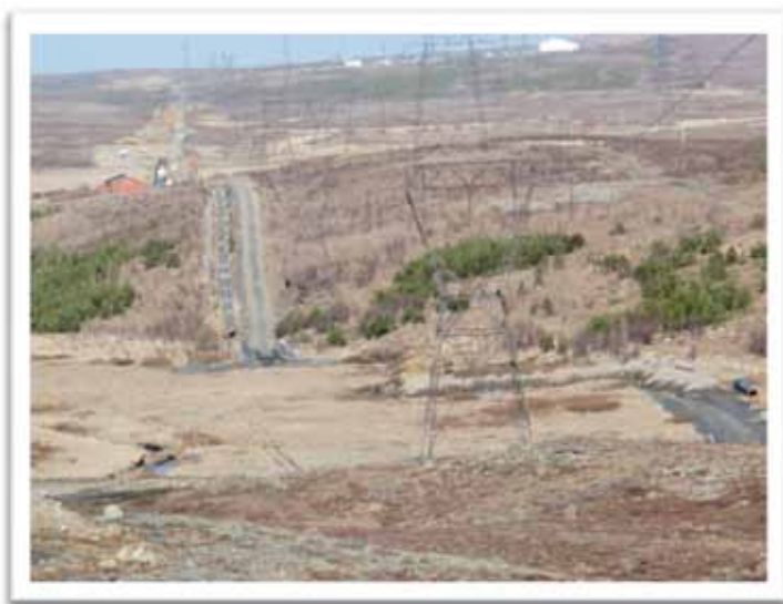
Mynd: Elliðakotsmýrar, fjær sér í spennistöð á Geithálsi.

Að loknum framkvæmdum við Hellisheiðaræð fjarlægði OR þjónustuvegin úr Elliðakotsmýrum (mynd) á um 250 mtr. kafla og að hluta til vestan við Sólheimakot, einnig voru fjærlægðir hlutar þjónustuvegarinn austast á svæðinu.