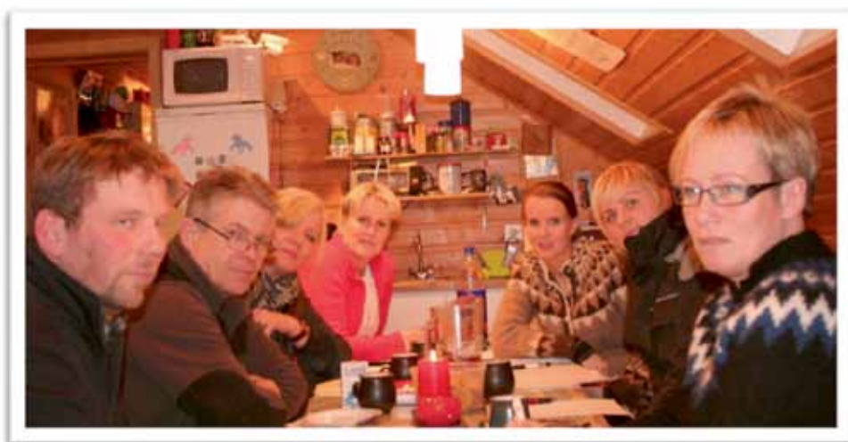
Mynd: fyrsti stjórnarfundur vetrarins