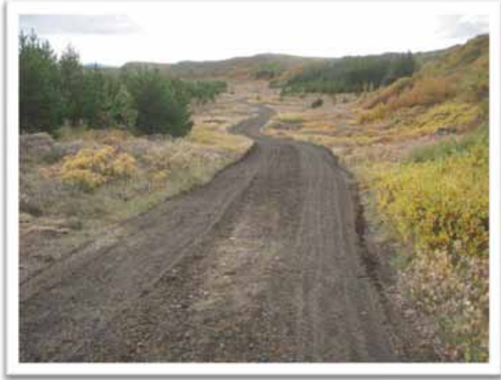
Mynd: Tungustígur, reiðvegur niður með Hjöllum.

Í Hjalladal var borið í reiðveg frá akvegi á um 600 mtr. kafla áleiðis upp í Hjallahvamm, en á þeim kafla var mikið orðið um staksteina.