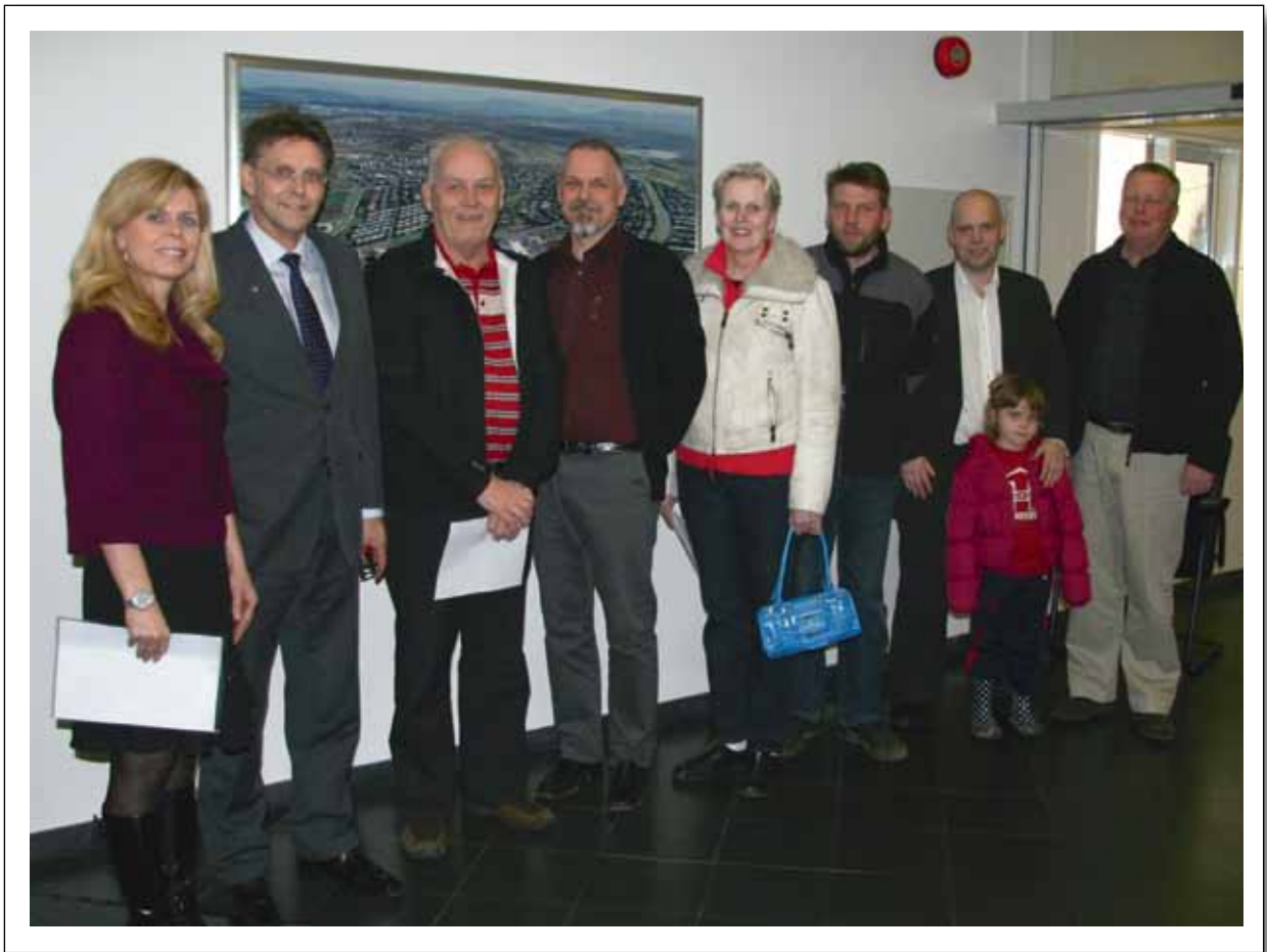
Mynd frá undirskrift samninga við Garðabæ