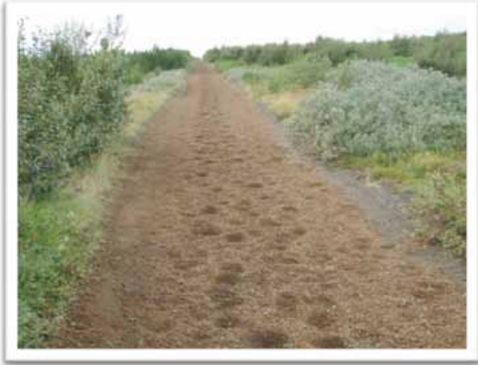
Mynd: Reiðvegur um Smalaholt

Á athafnasvæði okkar Andvaramanna hafa nú á haustmánuðum farið fram endurbætur á reiðvegi um Smalaholt (Betubraut), þ.e. skipt var um jarðveg og sett þúkk þar sem forarvilpa myndaðist ávalt í leysingum. Þá var sett yfirborðsefni frá Andvarasvæðinu að göngustíg sem er efst í brekkunni niður að Vífilsstaðavatni.