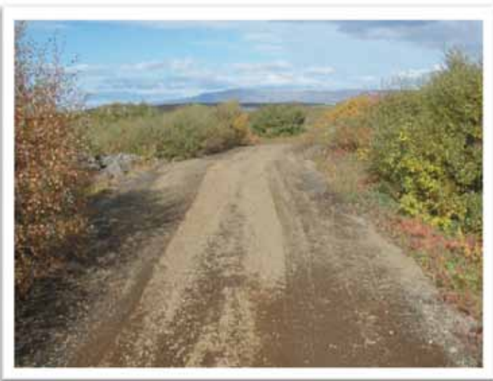
Mynd: Reiðvegur meðfram Elliðavatnsvegi.

Þá var sett nýtt yfirborðsefni á reiðveg meðfram Elliðavatnsvegi (Flóttamannavegi) þ.e. frá Vífilsstaðalæk og að reiðvegi inn með Vífilsstaðahlíð. Yfirborðsefni var einnig sett á reiðveg í Vífilsstaðahlíð austan við áningaslána sem er við línuveginn. Á um 500 mtr. kafla þar sem yfirborðsefnið var horfið að verulegu leyti og mikið um staksteina.