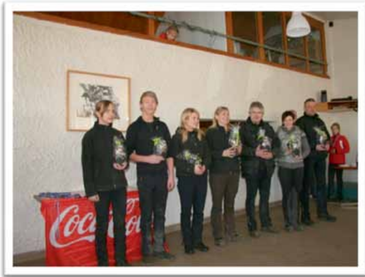
Mynd: samanlagðir sigurvegarar vetraleikanna.